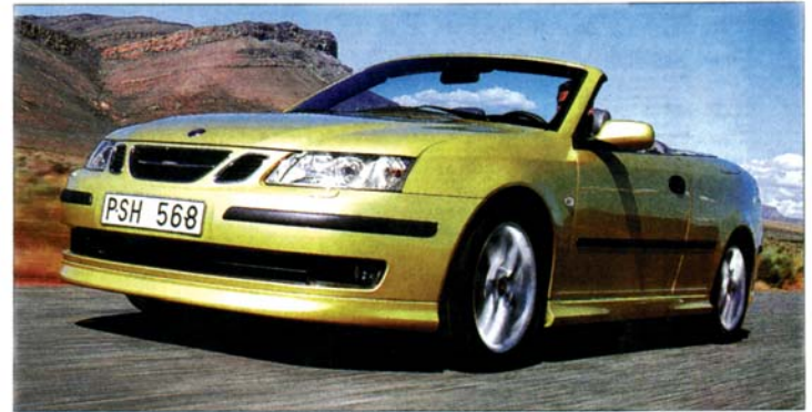
Dynamische Front als beim Vorgänger, aber ein Stückchen stylistische Individualität verloren: Saab 9-3 Cabrio

Mit einem offenen Viersitzer bereichert Saab seine Modellreihe 9-3. Das neue Cabrio macht vor allem technisch einen Schritt nach vorn.